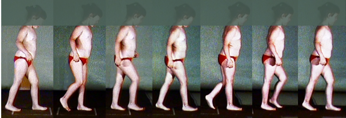
Abb. 4: Doppelschritt links-rechts-links, beidseitiges Aufsetzen mit flachem Fuß. (Bildserie von links nach rechts).

Nach 6 Therapieeinheiten kann das Kind mit der ganzen Fußsohle auftreten. Der Gang ist anfangs noch unsicher, das Kind geht mit leichter Oberkörpervorlage und mit langsamen, kurzen Schritten. Das normale Abrollmuster gelingt noch nicht, aber das Spitzfußmuster wird durch ein flaches Fußaufsetzen ersetzt.