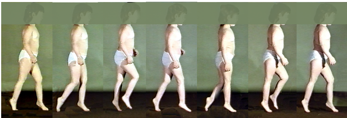
Abb. 3: Doppelschritt links-rechts-links, beidseitiges Spitzfußmuster und Streckmuster im Knie und im Sprunggelenk. (Bildserie von links nach rechts).

Bei Beginn der Therapie wird dem Kind die Sollmelodie (siehe Videofilm) vorgespielt und die ersten Versuche mit tonalem Feedback aufgezeichnet. Die Bildserie Abb. 3 zeigt einen der ersten Gangversuche mit Feedback. Die dabei produzierte Tonfolge beginnt mit einem Tongemisch, welches klar als abweichend von der Sollmelodie erkannt wird. Erst allmählich beginnt das Kind mit den Tönen zu spielen, indem es den Gang variiert.