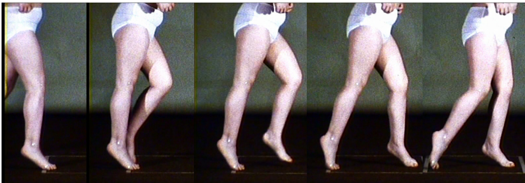
Abb. 1: Aufsetzen rechts mit gebeugtem Knie und Spitzfußhaltung (Bild 1), Streckung im Knie und im Sprunggelenk (Bilder 2-4), Aufsetzen links (Bild 5). (Bildserie von links nach rechts).

Das Kind geht mit hoher Ganggeschwindigkeit und beidseitig immer auf dem Spitzfuß. Bei Schrittbeginn wird der Fuß in Spitzfußstellung und mit leicht gebeugtem Knie aufgesetzt. Bei Beginn der Einzelstützphase erfolgt gleichzeitig im Sprunggelenk und im Knie eine totale Streckung, die bis zum Aufsetzen des vorderen Fußes